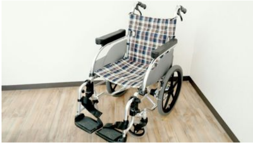
AR-600 株式会社松永製作所