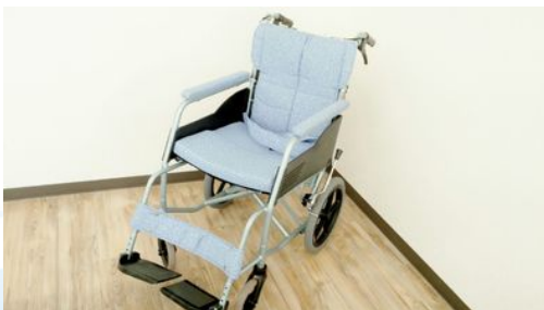
REM-8 株式会社松永製作所

■ウイング・スイングアウト・低座面使用・介助用ブレーキ・背折れジョイント・ワンタッチソフトシート・テンション調整式シート・クッションキャスター・ハイポリマータイヤ