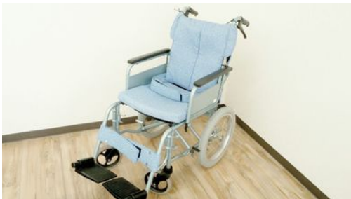
REM-4 株式会社松永製作所

■ドラム式介助ブレーキ機能付き・折りたたみ式バックサポート・手元ブレーキ・介護ブレーキ・着脱式アームサポート機能・跳ね上げ式アームサポート機能・着脱式フット、レッグサポート機能・開き式フット、レッグサポート機能付き。