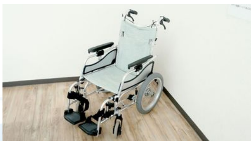
MW-SL6 株式会社松永製作所