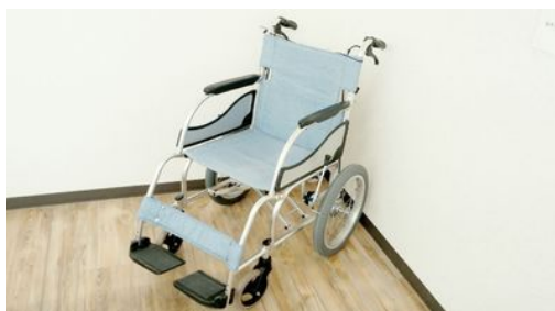
MW-SL2 株式会社松永製作所