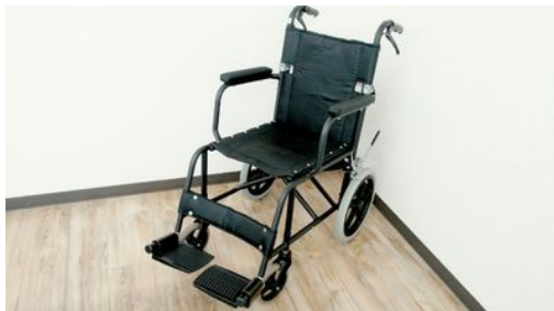
MW-E2 株式会社松永製作所