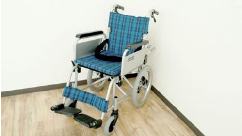
KA16-40HB 株式会社カワムラサイクル

■ウイング・スイングアウト・介助用ブレーキ・背折れジョイント ・テンション調整シート・クッションキャスト